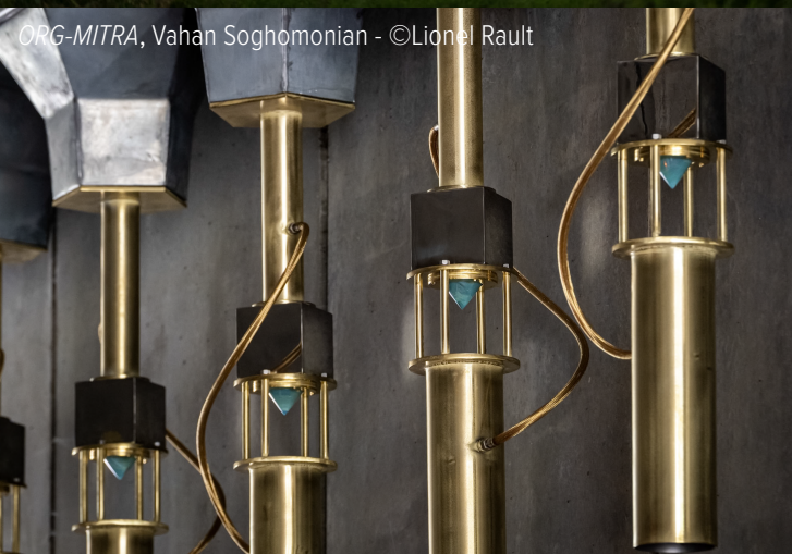
ORG-MITRA, Vahan Soghomonian - ©Lionel Rault