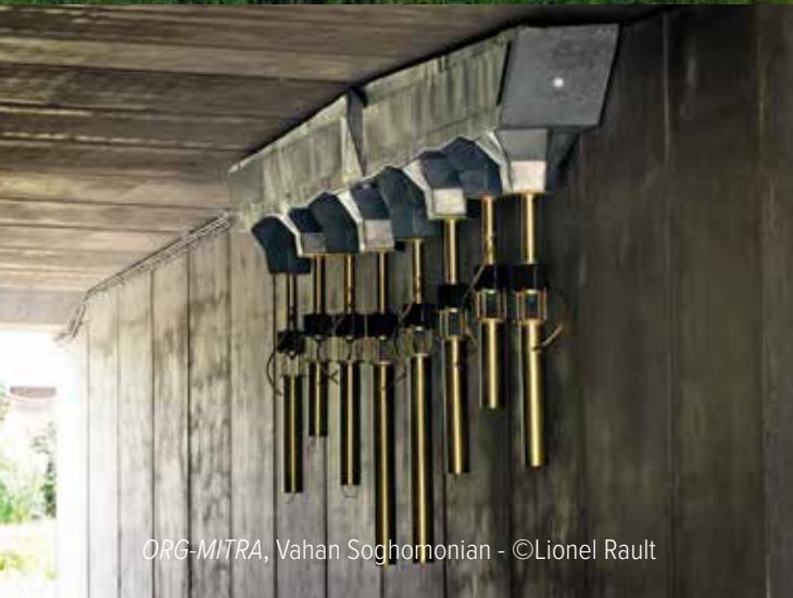
ORG-MITRA, Vahan Soghomonian