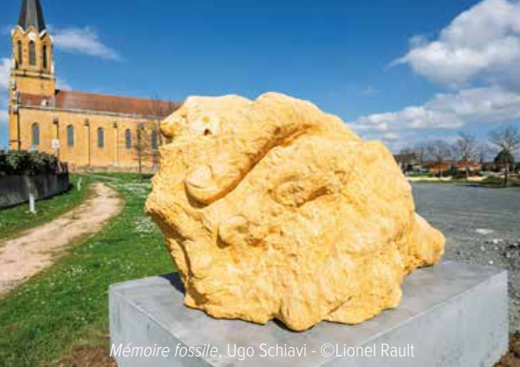
Mémoire fossile, Ugo Schiavi - ©Lionel Rault