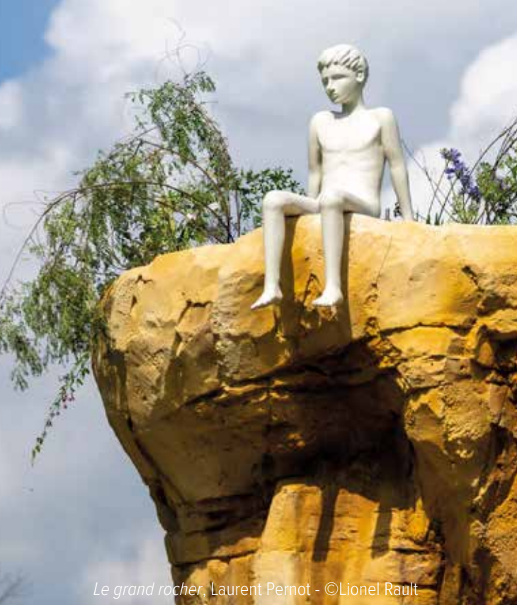
Le grand rocher, Laurent Pernot - ©Lionel Rault