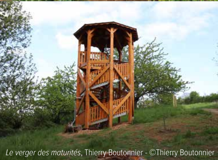
Le verger des maturités , Thierry Boutonnier - ©Thierry Boutonnier