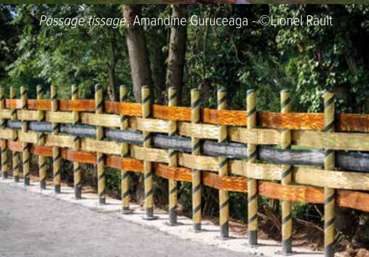
Passage tissage , Amandine Guruceaga