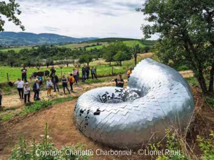
Cryptide , Charlotte Charbonnel - ©Lionel Rault